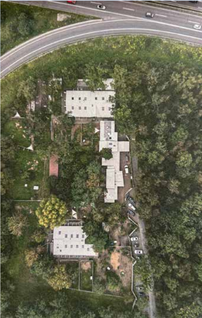
Drohnenaufnahme des jetzigen Tierheim-Standorts

Liebe Vereinsfördernde des Tierschutzvereins Darmstadt und Umgebung e.V., hiermit informiere ich Euch über die weitere Entwicklung unseres Tierheims.