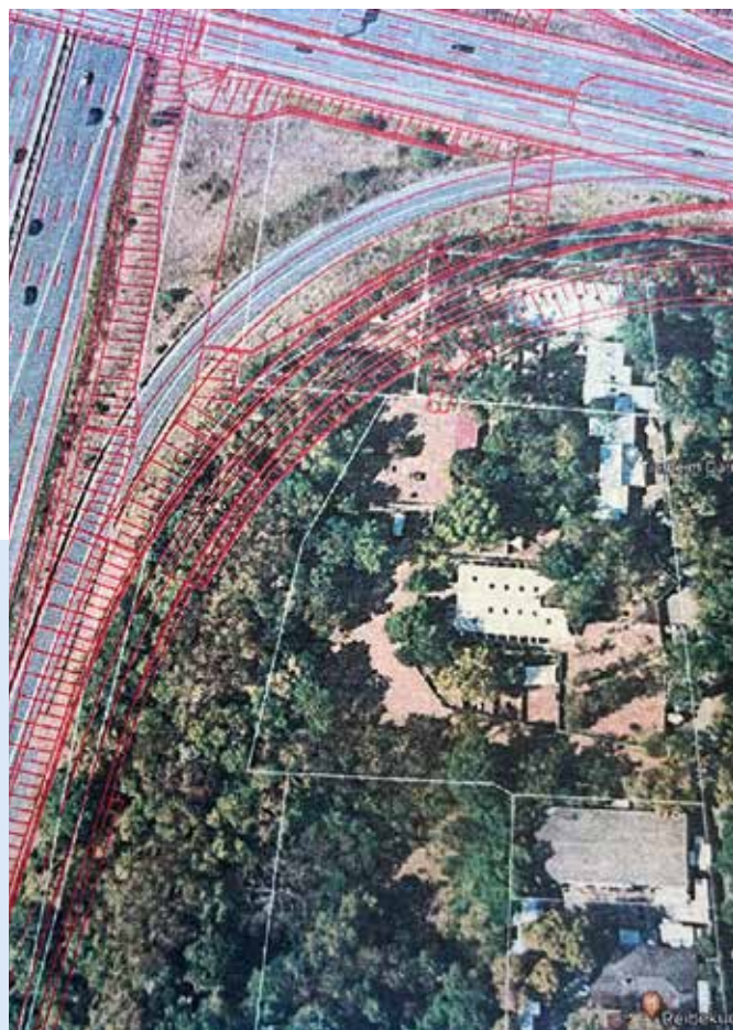
Geplanter Umbau des AB Nordkreuzes und Zubringer zur A672

wären wir mittelbar, beim Ausbau des Nordkreuzes wären wir unmittelbar betroffen. Durch die unmittelbare Betroffenheit des Nordkreuz-Ausbaus haben wir eine stärkere Argumentation gegenüber dem Bund, um eine höhere Entschädigung erzielen zu können. Außerdem konnte ich noch Armin Nagel als weiteren Berater gewinnen, der uns bei den zukünftigen Gesprächen mit der DB, der BAB GmbH und der Kommune unterstützen wird. Er war Pressesprecher des Verkehrsministeriums in der Regierung von Helmut Schmidt und heutiger Vorsitzender des Vereins Bahn und Kultur e.V.