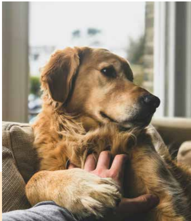
Viel mehr als „nur“ ein Haustier

Zahlreiche Studien belegen die positiven Effekte, die das Zusammenleben mit tierischen Sozialpartnern bewirkt. Haustiere fördern unsere kognitive, emotionale, soziale und körperliche Entwicklung. Ob Näpfchen füllen, Gassi gehen, Arztbesuch oder Urlaub planen – wir müssen uns kümmern, Bedürfnisse erkennen und erfüllen, Entscheidungen treffen und manchmal auch erst lernen, Kompromisse zu schließen. Zudem verbessern Fellnasen unsere physische wie psychische Gesundheit. Denn abgesehen davon, dass vor allem Hundebesitzer häufiger die von der WHO definierten Bewegungsziele erreichen, trägt die Interaktion zwischen Mensch und Tier dazu bei, Stress zu reduzieren und Immunsystem sowie das allgemeine Wohlbefinden zu verbessern. Darüber hinaus helfen Tiere beim vielleicht gravierendsten Problem unserer Zeit: Einsamkeit. Die zwar keine Krankheit ist, aber ernsthaft krank machen kann. Was dagegen helfen kann: ein Hund. Das jedenfalls hat eine Studie des UKE in Hamburg belegt, die den Zusammenhang vom Haustierart und psychosozialen Ergebnissen wie Einsamkeit untersucht hat.