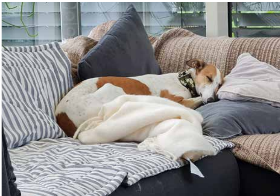
Blümchen hat die Couch erobert

Blümchen ist im Haus ruhig und gelassen solange sie ihre Körbchen, ihr Sofa, einen Berg Kissen und Decken und rechtzeitig ihr Fressen hat und nicht zu vergessen, intensive Kuscheinheiten und zu Massagen sagt sie auch nicht nein. Draußen ist meine Lütte sehr neugierig, aufgeweckt und hat immer die Nase im Wind, um eine Fährte eines Rehs oder Hasen zu erschnuppern und ist wahnsinnig gelehrig. Es ist so wohltuend, wenn sie immer wieder prüft, ob ihr Zweibeiner am Ende der Leine noch da ist, im Zweifel, um ein Leckerli zu erbeuten, was sie dann natürlich auch bekommt. Geteilte Freude ist ja bekanntlich doppelte Freude.